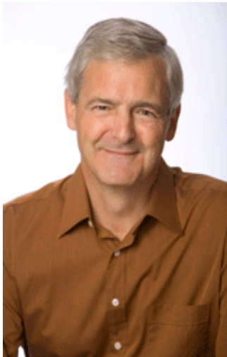
Marc Garneau, P.Eng., député de Westmount – Ville Marie, QC