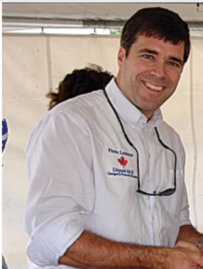
Pierre Lemieux, député

En octobre 2007, le premier ministre nomme M. Lemieux au poste de secrétaire parlementaire aux Langues officielles ainsi qu'au poste de whip adjoint du gouvernement.