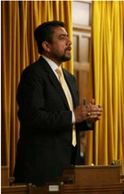
Sukh Dhaliwal, P.Eng., député de Newton – North Delta, BC